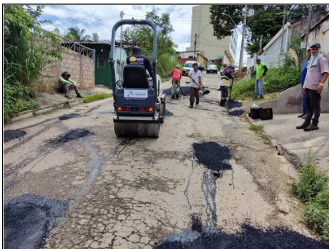
3 - PAVIMENTAÇÃO DE RUAS